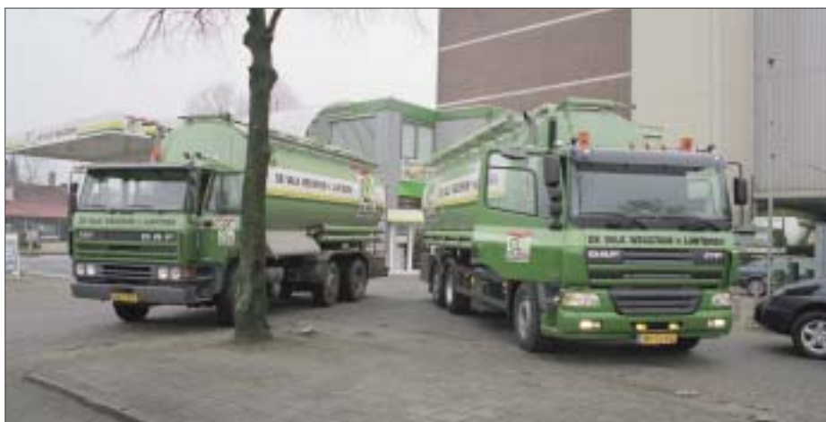
"Oud en nieuw"