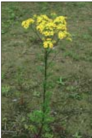
Jacobskruiskruid maximale hoogte 90 cm.

bekend waar deze plant tot sterfte bij melkvee heeft geleid. Wanneer u voornemens bent ingekuild gras of hooi te kopen vraag dan naar de herkomst. (natuurgebieden zijn verdacht)