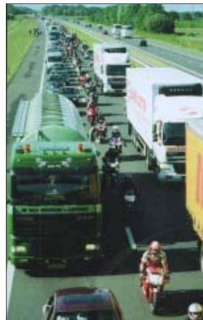
Een opletende lezer signaleerde ons in de buurt van Assen tijdens de TT 25 juni j.l.