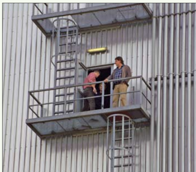
Vanzelfsprekend lieten we ook graag onze eigen fabriek zien. Het walsen en zeven van pluimveevoeders, de bedieningskamer, de nieuwe microdosering van vitamines, mineralen en andere hoogwaardige componenten, de CCM-verwerking en de laadstraten lieten zien dat er nog heel wat bij komt kijken alvorens het voer bij u in de silo zit.