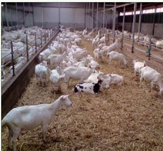
Fam. Van den Top te Lunteren verwelcomden de bezoekers in hun onlangs uitgebreide stallen met een 64-stands draaimelkstal voor 1.000 melkgeiten en met een automatisch voersysteem. Ook een stal met dubbeldoel melkvee en de opfok van jongvee op stro in een hellingstal kon bezichtigd worden.