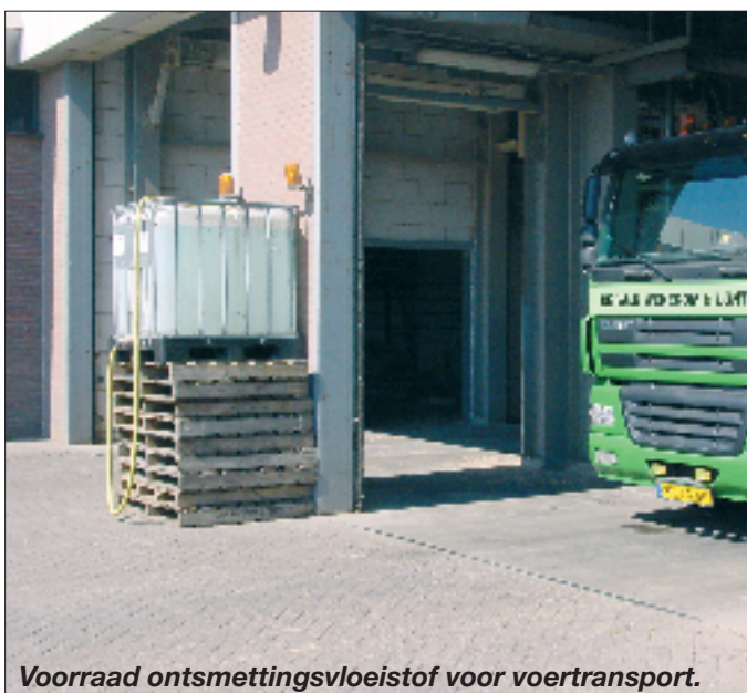
Voorraad ontsmettingsvloeistof voor voertransport.