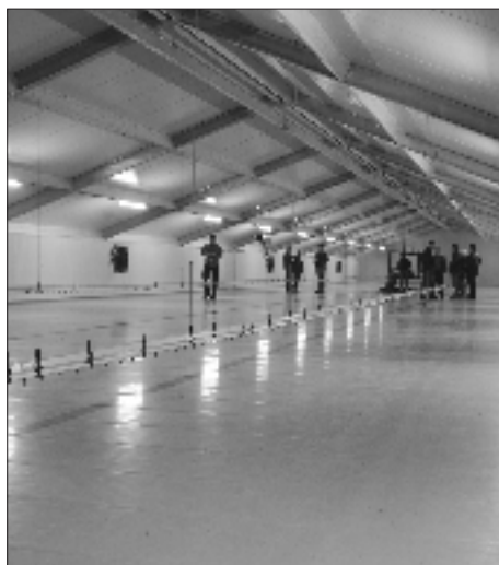
Stal 1 e verdieping