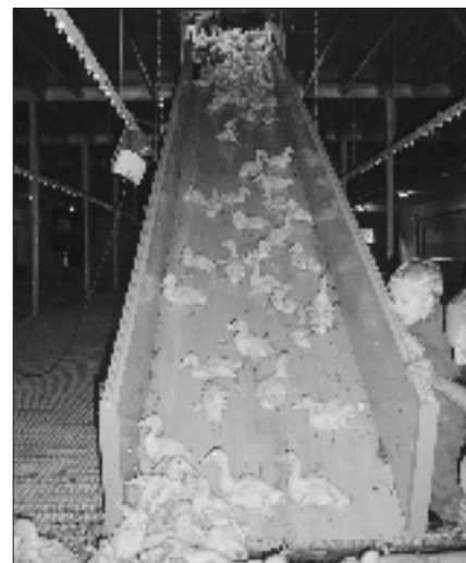
Eendjes via glijgoot naar begane grond